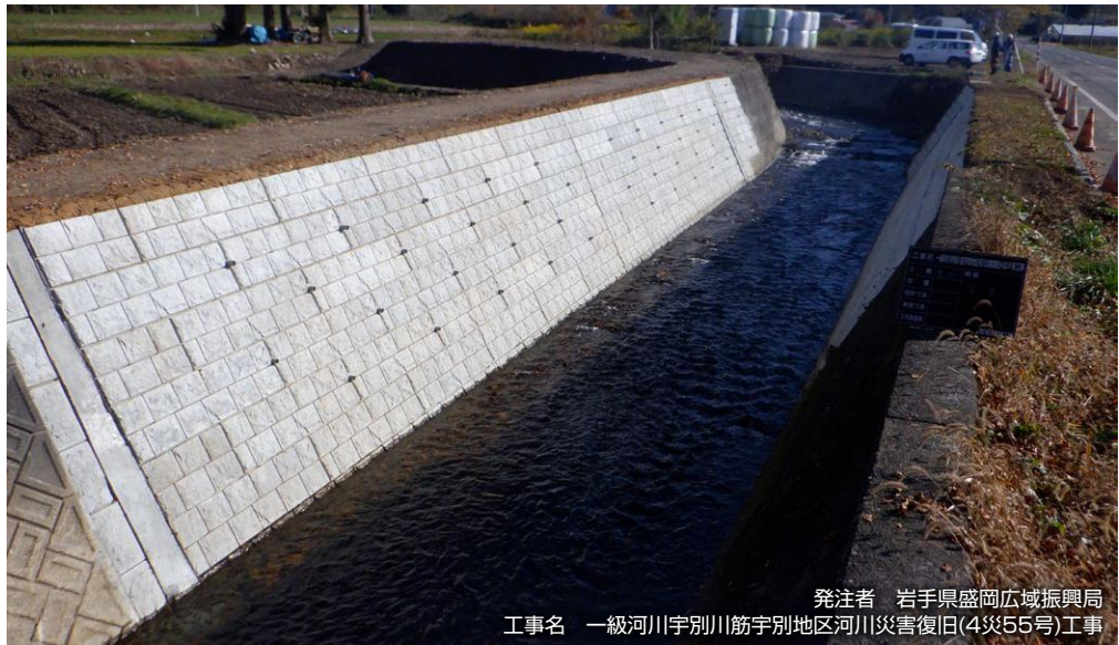
発注者 岩手県盛岡広域振興局 工事名 一級河川宇別川筋宇別地区河川災害復旧(4災55号)工事